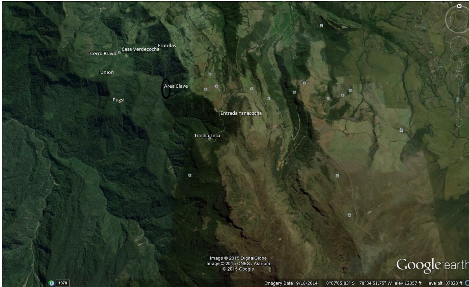
Reserva Yanacocha-Verdecocha 1